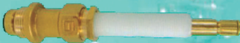
Embolo repuesto llave empotrar 50-904 (8GR50904)