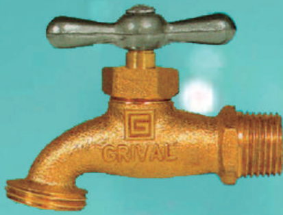
Llave de chorro 1/2" 50-206 (8GR50206)