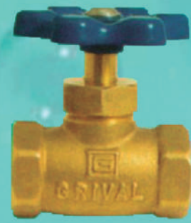
LLave de paso salv 1/2" 50-241 (8GR50241)